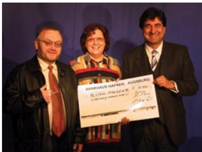
80.000 Euro kamen beim Weihnachtswunschkonzert von Radio Fantasy zu-

Wenngleich das Fantasy-Weihnachtswunschkonzert von jedem teilnehmenden Hörer ein finanzielles Opfer forderte, so war das Spenden doch mit einer Menge Spaß verbunden. Denn letztlich gab es für das gute Geld auch ohne Ende tolle Musik auf die Ohren. Die meistgewünschten Titel waren übrigens Shut up von den Black Eye Peas, White Flag von Dido und Behind Blue Eyes von Limp Biskit.