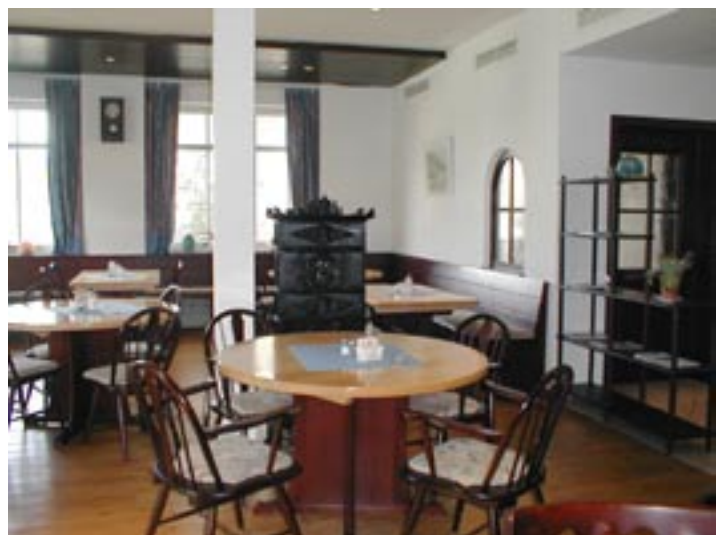
Eine gemütliche Atmosphäre erwartet Sie in den Lohwald-Stuben.

Die Lohwald-Stuben eignen sich auch für Feierlichkeiten aller Art. Mit der großen Stube und drei angenehmen Nebenräumen - eins davon für Nichtraucher - bietet sich für jede Gelegenheit der richtige Platz. Natürlich stehen auch genügend Parkplätze vor dem Haus zur Verfügung und wer mit den öffentlichen Verkehrsmitteln kommen möchte: Das Gasthaus befindet sich genau gegenüber der Haltestelle Lohwald der Buslinie Nr. 500.