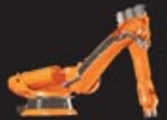
KR 150 K/180 K/210 K Serie 2000