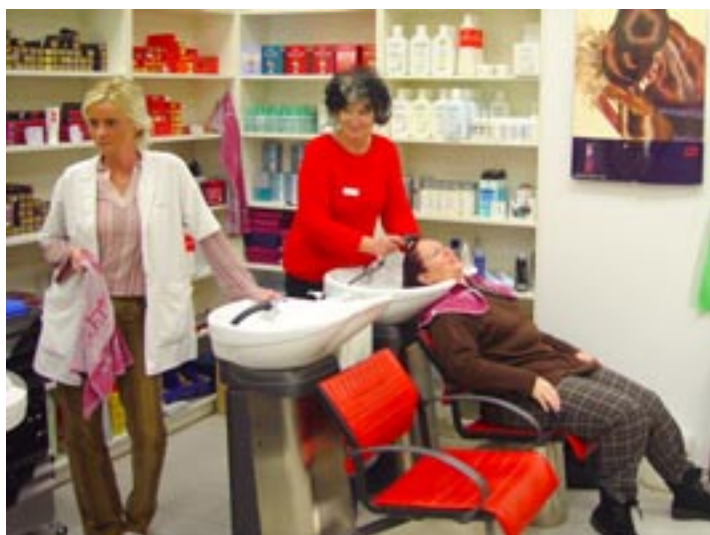
Der Salon Top Hair im Kaufland in Neusäß.

Die Friseurkette Top Hair, die mit über 60 Filialen im gesamten Süddeutschen Raum vertreten ist, bietet auch in Neusäß einen modernen Salon. Die Philosophie der Kette ist klar und durchdacht. Top-Mode, Top-Schnitte, Top-Preise heißt das Motto der aus Augsburg stammenden Friseurdienstleister.