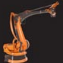
KR 180 PA

KUKA Roboter gibt es in allen Arten. Und in jeder Größe. Für die verschiedensten Anwendungen.