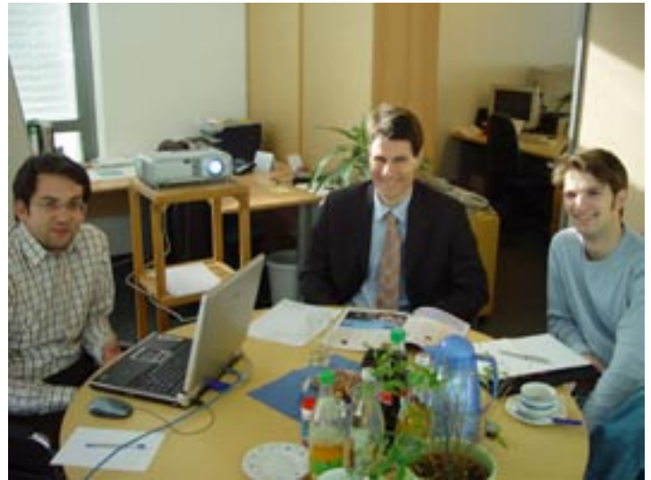
Foto am Besprechungstisch.

Zudem entwickelt gogol medien webbasierte Individualsoftware für die Verlags- und Medienbranche für Kunden wie WEKA MEDIA (Feuerwehr-Aktuell, Manager-Solutions, Agrar-Info, QM-Web, Einkauf & Logistik), WEKA Wien, GWI, INTEREST, TURNUS und Newsfactory (Relaunch des Opernportals der Bayerischen Staatsoper, Flashspiel für Exquisa, Marktplatz der Augsburger Allgemeinen Zeitung), einem Tochterunternehmen der Mediengruppe Pressedruck. Der Schwerpunkt liegt in den Bereichen Content-Management-Systeme und Web-Services.