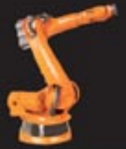
KR 150/180/210 Serie 2000