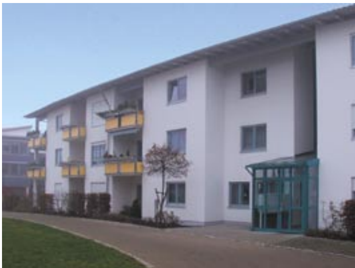
Die Seniorenwohnanlage in der Marienbader Straße 1 in Neusäß

Gerade wenn man älter wird, ist es eine Herausforderung, die Zukunft zu planen. Denn im Alter möchte niemand auf seine Selbstständigkeit, Unabhängigkeit und seinen gewohnten Komfort verzichten. Dies erfordert jedoch eine geeignete Wohnform. Das beschwerliche Treppensteigen, der Unterhalt einer großen Wohnung oder eines eigenen Hauses mit Garten kann im Alter immer mehr zur Belastung werden.